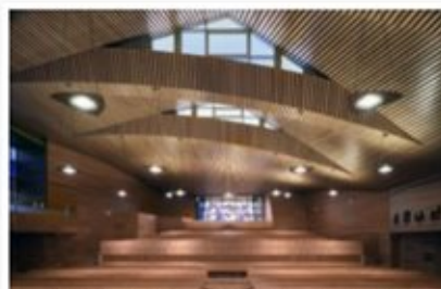
Interior del oratorio del Colegio Retamar de Madrid desarrollado íntegramente en bambú por Grupo GUBIA. Fotografías © Javier Orive para Grupo GUBIA. Todos los derechos reservados.

Las prestaciones, no sólo técnicas y en términos de resistencia y durabilidad del bambú, sino también sus cualidades medioambientales y ecológicas están situando a este material como una alternativa cada vez más recurrente y de gran valor en los proyectos de arquitectos, constructores e interioristas de todo el mundo. Grupo GUBIA, líder en el diseño y construcción de todo tipo de espacios en madera, es experto en trabajos con bambú y diseña y fabrica a medida desde mobiliario y carpinterías en este material, hasta revestimientos, tarimas, escaleras o estructuras muy complejas, dado que sus extraordinarias características mecánicas lo hacen apto para cualquiera de estos usos.