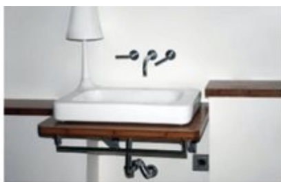
Diseño y fabricación de encimera de lavabo para baño realizada con tableros de bambú tostado barnizados GUBIA BSP C-h.

de proyectos en los que el bambú es el principal protagonista. Además de las bondades ecológicas ya mencionadas, sus amplias posibilidades estéticas (en cuanto a color natural/tostado y acabado) permiten su adaptación a cualquier espacio, tanto público como privado, imprimiendo a la atmósfera un toque cálido y acogedor, además de un look depurado, sencillo, contemporáneo y vanguardista.