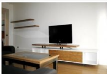
Mediante el uso de líneas y volúmenes puros, la elección de materiales naturales en tonos neutros y el diseño de muebles a medida se consigue un interior donde se respira tranquilidad y en el que se aprovecha al máximo el espacio disponible. Fotografías © Grupo GUBIA.

Los dueños de los apartamentos querían usar una madera clara combinada con el color blanco para conseguir un diseño actual, cálido y que genere sensación de amplitud. Grupo GUBIA les propuso el uso del bambú como alternativa, ya que presenta un excelente comportamiento en ambientes húmedos. Fotografías © Grupo GUBIA.