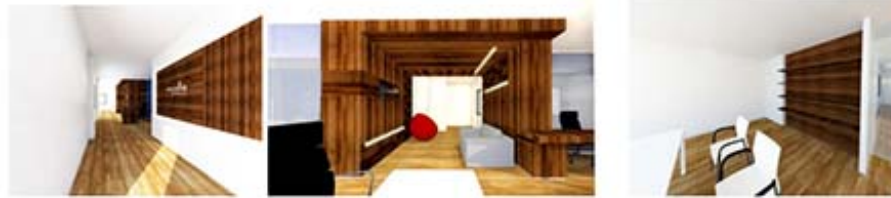
PLANO Y RENDERS